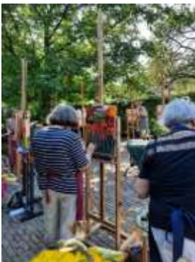
Montmartre op de Heikant

Ik ben nu 83 jaren oud en soms denk ik, als ik 's morgens voor de spiegel sta: waarom heb ik tepels, ik heb nooit een kind hoeven zogen. Nooit heb ik gehoord dat er mannen zijn die een kind de borst kunnen geven. Ik zal P. T. de Chardin nog eens raadplegen waar ergens in de tijd het mannelijke en het vrouwelijke bij de levende wezens elk zijn/haar weg is gegaan!!!! Ik denk dat hij dat niet heeft kunnen duiden.