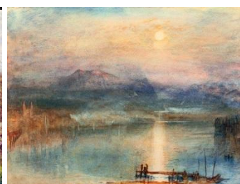
Turner Lake Lucerne 1841