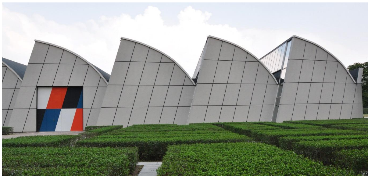
-Weverij "De Ploeg"-

Sinds 2007 worden er geen (Ploeg)-stoffen meer geweven. Het gebouw heeft enkele jaren leeggestaan, maar na een restauratie in 2016 is er nu een ander bedrijf in gehuisvest en wel : Bruns BV een bedrijf dat gespecialiseerd is in inrichten van musea en tentoonstellingen. De fabriek met omliggend park is inmiddels een rijksmonument.